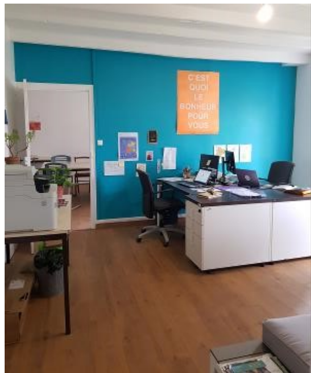
« Maison de Lucie », avant/après les travaux